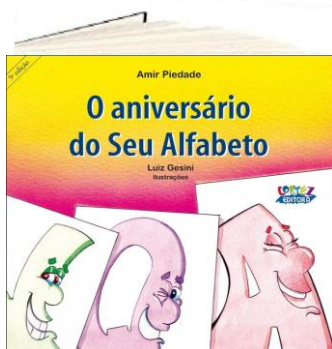
O ANIVERSÁRIO DO SEU ALFABETO (Autor: Amir Piedade. Editora: Cortez)