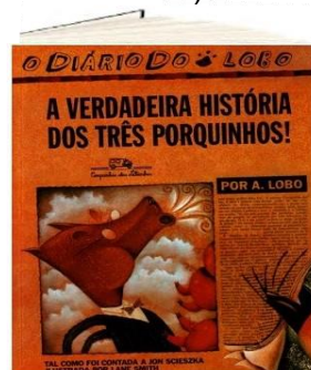
A VERDADEIRA HISTÓRIA DOS TRÊS PORQUINHOS (Autor: John Scieszka - Editora: Companhia das Letrinhas).