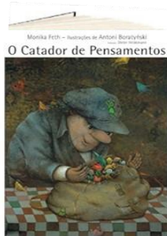
O CATADOR DE PENSAMENTOS (Autor: Mônica Feth - Editora: Brinque Book).