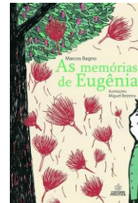
As Memórias de Eugênia (Autor: Marcos Bagno/ Editora: Positivo).