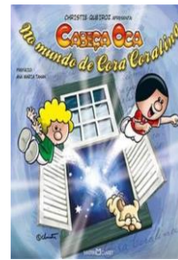
O Cabeça Oca no Mundo de Cora Coralina (Autora: Christie Queiroz/ Editora: Kelps).