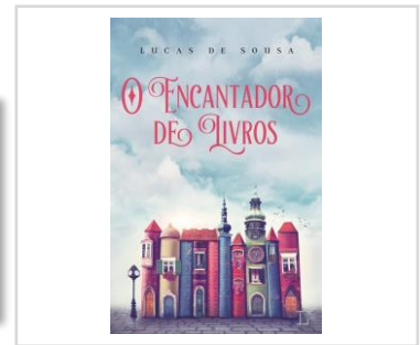
O Encantador de Livros (Autor: Lucas de Sousa). Editora: Ler Editorial