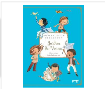
Jardim de Versos (Autora: Robert Louis) Editora: FTD