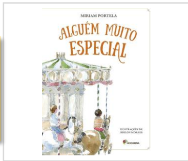
Alguém Muito Especial (Autora: Miriam Portela) Editora: Moderna